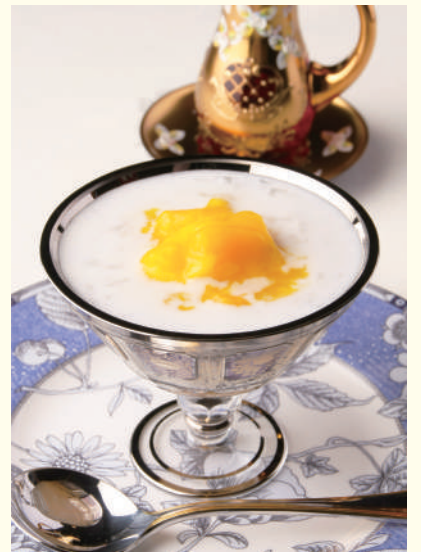
燕の巣マンゴー載せ