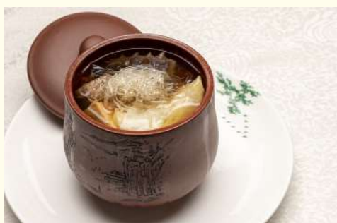
佛跳牆 (山珍海味のスープ)