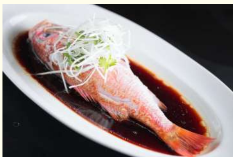
広東風ノドグロ清蒸し