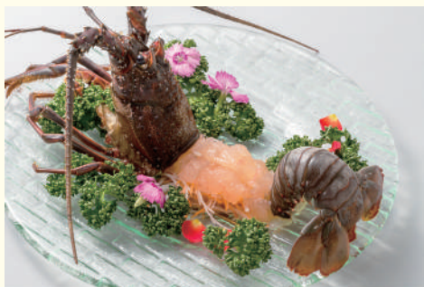
伊勢エビのお造り